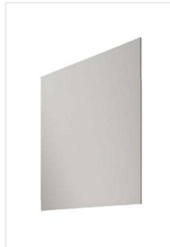
FL60 Specchiera panoramica L.62-H.70-P.2