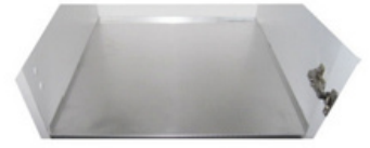
Fondo in alluminio impermeabile Waterproof aluminum layer