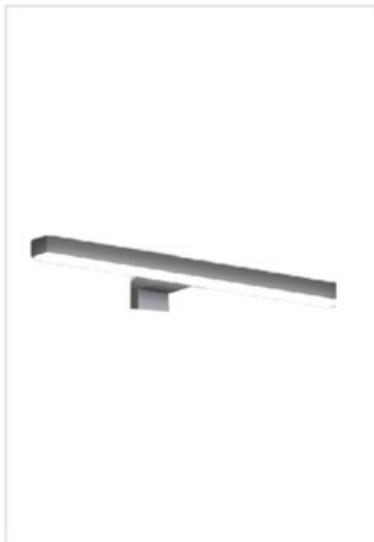
ILL02 Lampada LED - City L.30-H.3,5-P.10