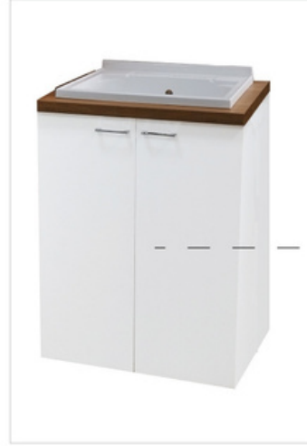
252 Lavatoio da incasso, asse in legno vasca in metacrilato L.71-H.91-P.65