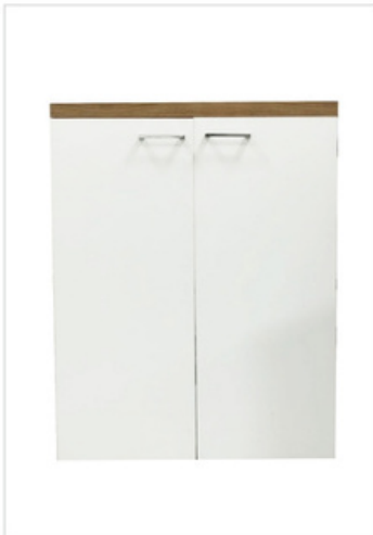
253 Mobile Multiuso con mensola interna L.71-H.91,6-P.65