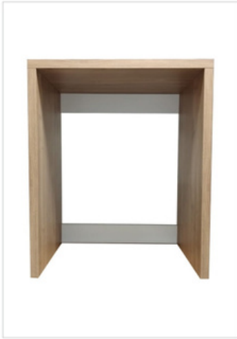
250 Porta lavatrice/asciugatrice a giorno Misure Esterne L.78,5-H.91-P.65 Misure Interne L.71-H.86-P.63,5