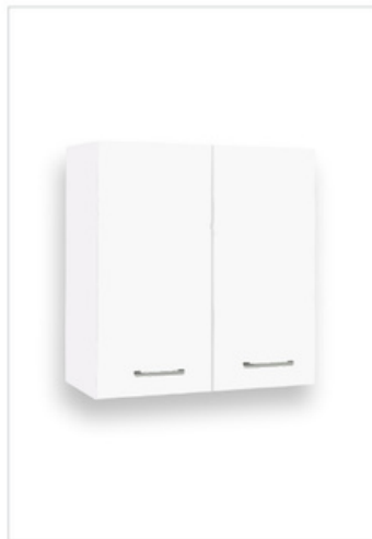
254 Pensile doppio L.68-H.71-P.22