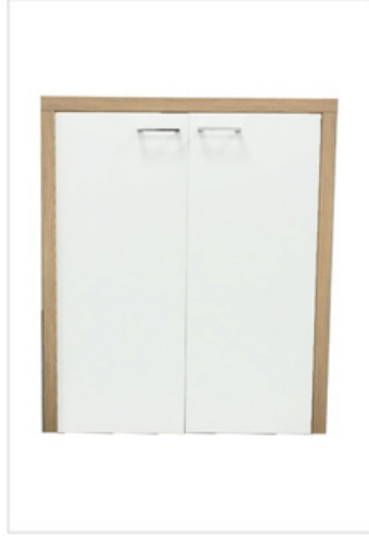
251 Porta lavatrice/asciugatrice con ante Misure Esterne L.78,5-H.91-P.65 Misure Interne L.65-H.86-P.62