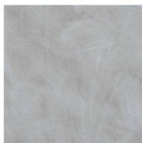
Grigio Spatolato Brushed Grey